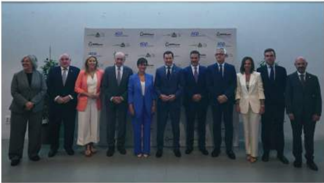
IV Congreso Nacional de Vivienda, en Málaga.