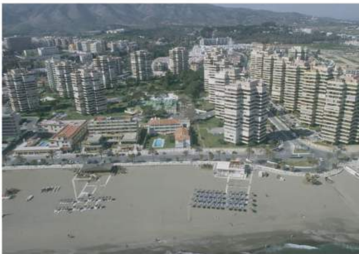
en el momento de la construcción.

La provincia es el cuarto territorio en la compraventa de hogares por parte de personas de otros países con un 33,5% de las operaciones