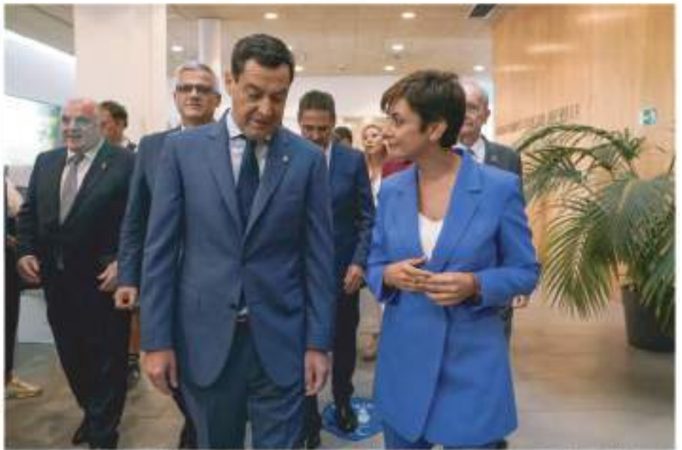
El presidente de la Junta de Andalucía, Juanma Moreno, junto a ministros de Finanzas y Agenda Urbana, Isabel Rodríguez, durante el IV Congreso Nacional de Ciudades en Málaga, 14 de septiembre.

Los presidentes de la Xunta de Galicia y de la Junta de Andalucía acudirán el viernes a La Moncloa para una cita en la que descartan negociar bilateralmente sobre financiación