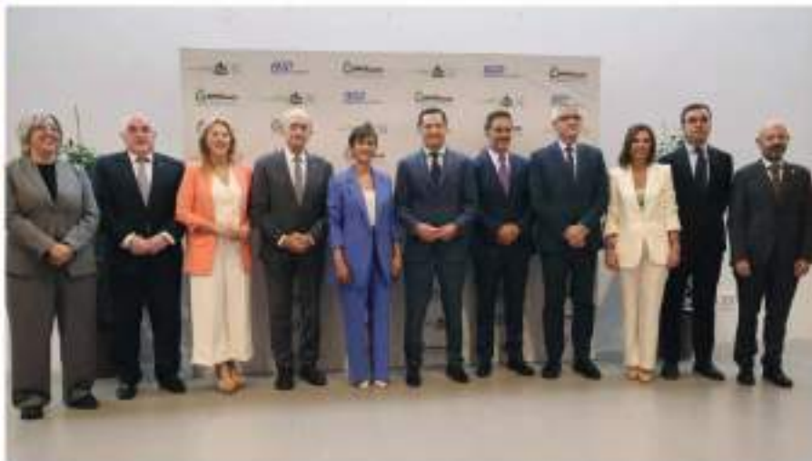
Representantes de las administraciones, promotores y constructores durante el Congreso Nacional de Vivienda en Málaga.

El alcalde de Málaga pide más fondos europeos para construir VPO