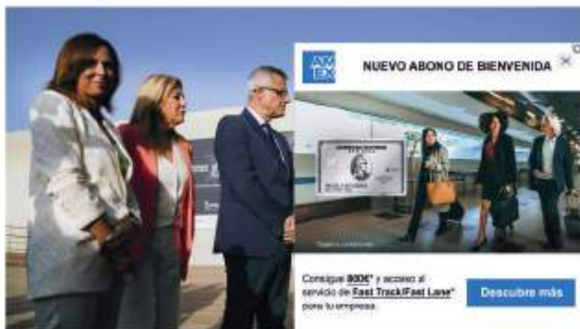
La ministra de Vivienda, Isabel Rodríguez, inaugura el IV Congreso Nacional de Vivienda en Málaga.