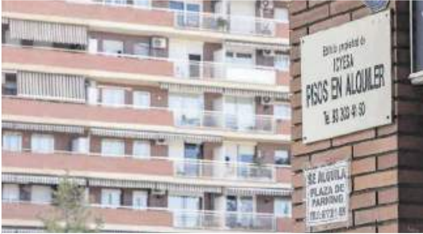
Cartel que promociona pisos en alquiler en el distrito barcelonés de Sant Martí.