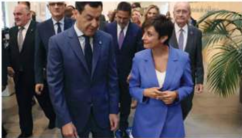
El presidente de la Junta, Juanma Moreno, y la ministra de Vivienda, Isabel Rodríguez, dialogan antes del Congreso de Vivienda.

Málaga registró más de 3.000 nuevos demandantes de vivienda protegida sólo en julio y agosto