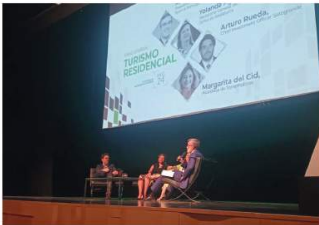
Mesa de debate sobre el turismo residencial. Sur

El auditorio aplaude una intervención del consejero delegado de Colliers en la que pone en duda el efecto de las limitaciones a los alquileres vacacionales