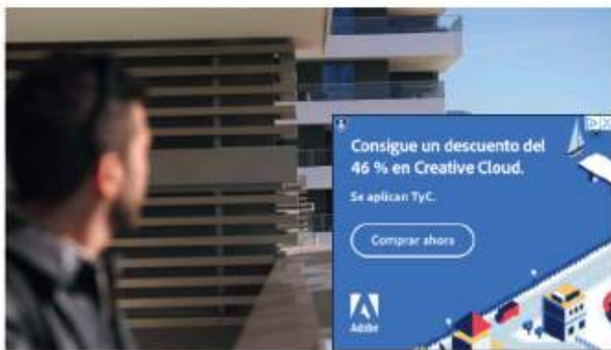
Una imagen delitoral oeste de Málaga capital.