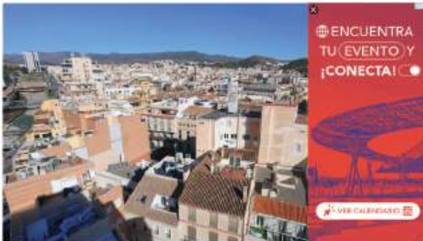
Proyectos de viviendas en la zona sur de Málaga. JÓYER AL BIÑANA

Los promotores exigen en Málaga agilizar los trámites para construir vivienda: "Con la IA tardamos 10 horas en hacer un proyecto y tramitar el suelo ocupa 10 años"