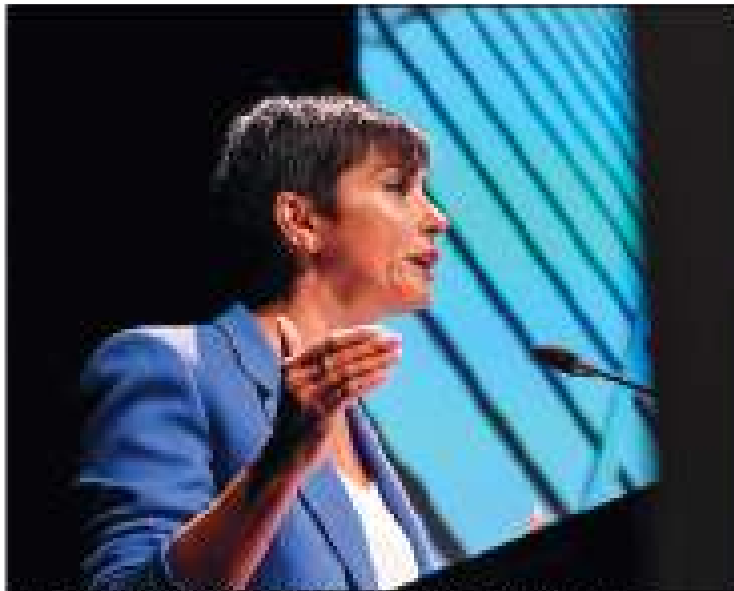
La ministra de Vivienda, Isabel Rodríguez, durante la inauguración de un ciclo de conferencias en Málaga.

MANUEL FERRÁS MORALES La ministra de Vivienda, Isabel Rodríguez, anunció ayer al Pleno del Congreso Nacional de vivienda que se va a iniciar en Málaga, bajo el patrocinio de un espacio de debate - durante un día - un ciclo de conferencias y se va a iniciar a prometa para mejorar la construcción de viviendas sociales en la ciudad, entre ellas en el barrio de San Andrés, Juan Ramón Moreno, que se anunció una nueva Ley de Vivienda regional para la próxima mitad de año y se iniciará a priori la misma para que la ministra, la presidente que sea promotoras de acción con el sector a través que PSOE y PP puedan sacar ahora en materia de política social en el Mercado Libre. En el auditorio que acogió el evento, casualmente de visita de periodistas, periodistas y representantes de sector inmobiliario y de vivienda social y sus parientes, se debatieron la importancia de vivienda social y se discutieron la falta de acciones y de acuerdo político para abordar la cuestión.