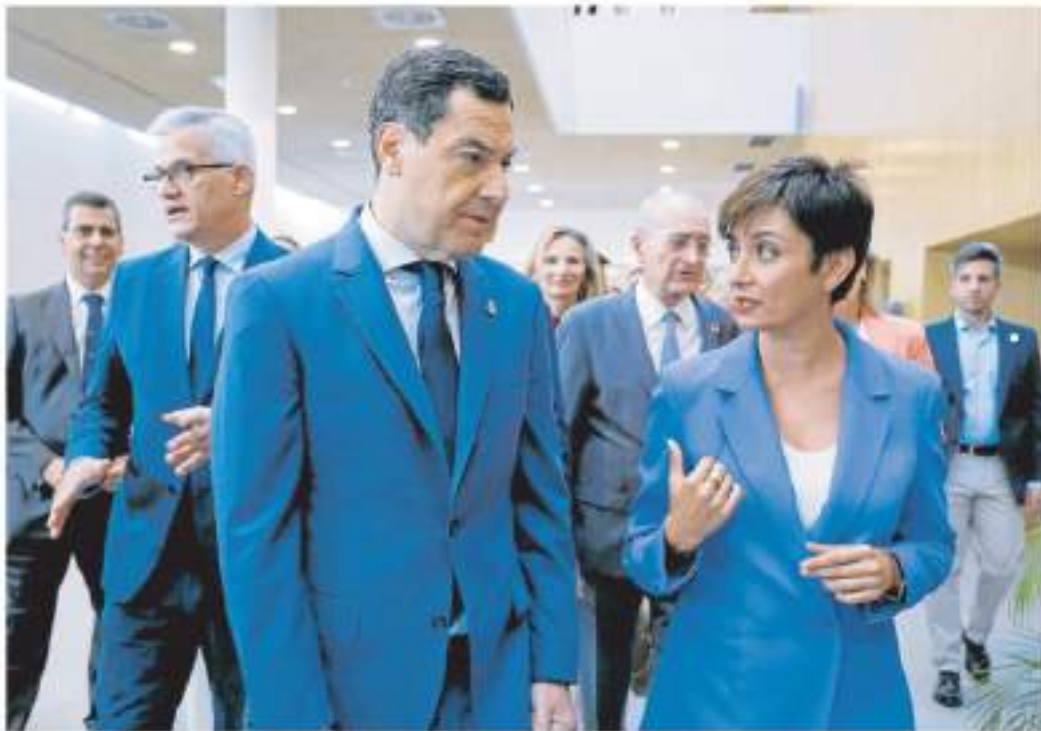
El presidente de la Junta, Juanma Moreno, y la ministra de Vivienda, Isabel Rodríguez, ayer en Málaga.

Para el presidente de la Junta las administraciones tienen que hacer un esfuerzo por reducir el desequilibrio que hay entre oferta y demanda