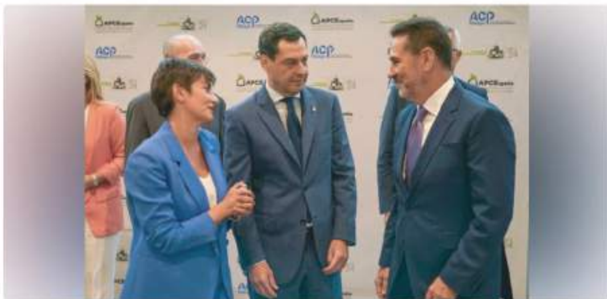
La ministra de Vivienda y Agenda Urbana, Isabel Rodríguez, y el presidente de la Junta de Andalucía, Juanma Moreno, conversan en el IV Congreso Nacional de Vivienda, este lunes en Málaga.

Historia de Europa Press • 1 semana(s) • 3 minutos de lectura